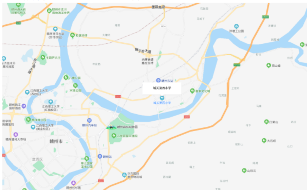
图 1-1 项目地理位置图

赣县区城关第四小学扩建工程项目位于赣州赣县区梅林镇章贡路 55 号。项目区地块位于赣县区梅林镇人民政府西南侧，直线距离约 0.7km。地块东侧和北侧为城关小学、地块南侧为赣县区城关第四小学、地块西侧和东侧道路为章贡路、地块北侧道路为梅林大街。行政区划隶属赣州市赣县区管辖。中心坐标：E:115° 0' 28.85"、N:25° 51' 21.65"。项目地理位置图见图 1-1。项目区地貌类海拔高度为 107.30m-118.41m 之间，建成后地面标高在 107.80m-113.9m 之间。