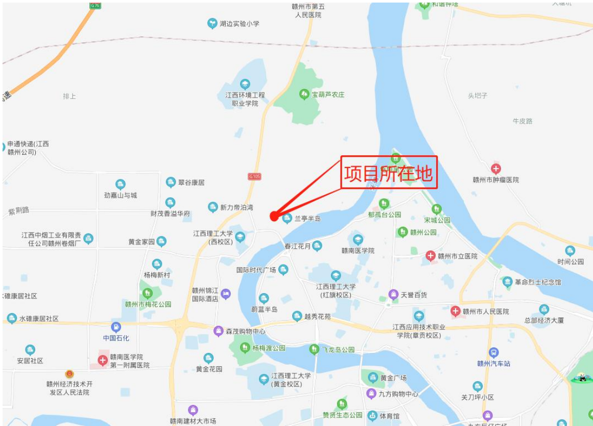
图 1-1 项目地理位置图

怡和·金苹果位于位于赣州章贡区水西镇水西村铁树下，兰亭半岛住宅区西侧。地块紧临住宅生活区，位于西河大桥北侧、东侧为兰亭半岛生活住宅小区、地块西侧和南侧为宋城路。行政区划隶属赣州市章贡区管辖。中心坐标：E:114° 55' 10.46"、N:25° 51' 45.90"。项目地理位置图见图 1-1。