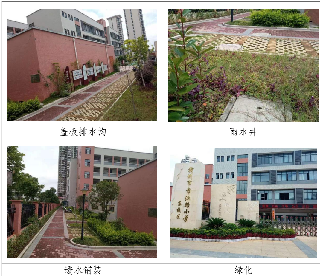
图 1-1 项目区现状照片

地下设有一层地下室，地下室面积 1964.6m 2 ，其底板标高为 106.2m，室外地下车库顶板覆土厚度约 1.0m 左右之间，建成后设计地面高程为 112.2m。