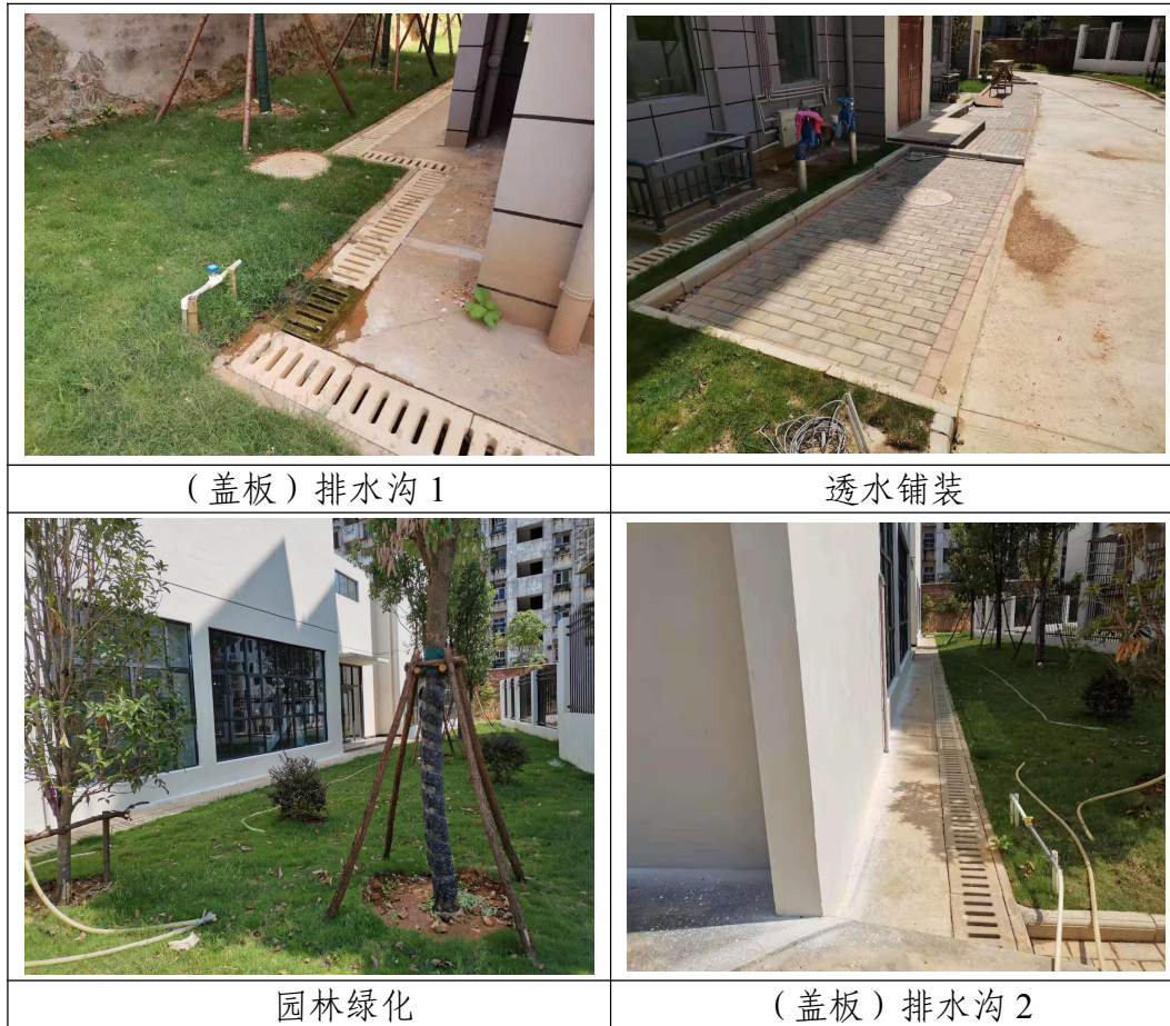
图 2-1 项目区现状情况

本项目于 2019 年 4 月开工建设，至 2021 年 5 月竣工并投入使用，总工期为 26 个月。主体工程设计的各项水土保持措施已全部实施，措施数量充足，防治效果明显，其中排水设施运行良好，植被生长良好。