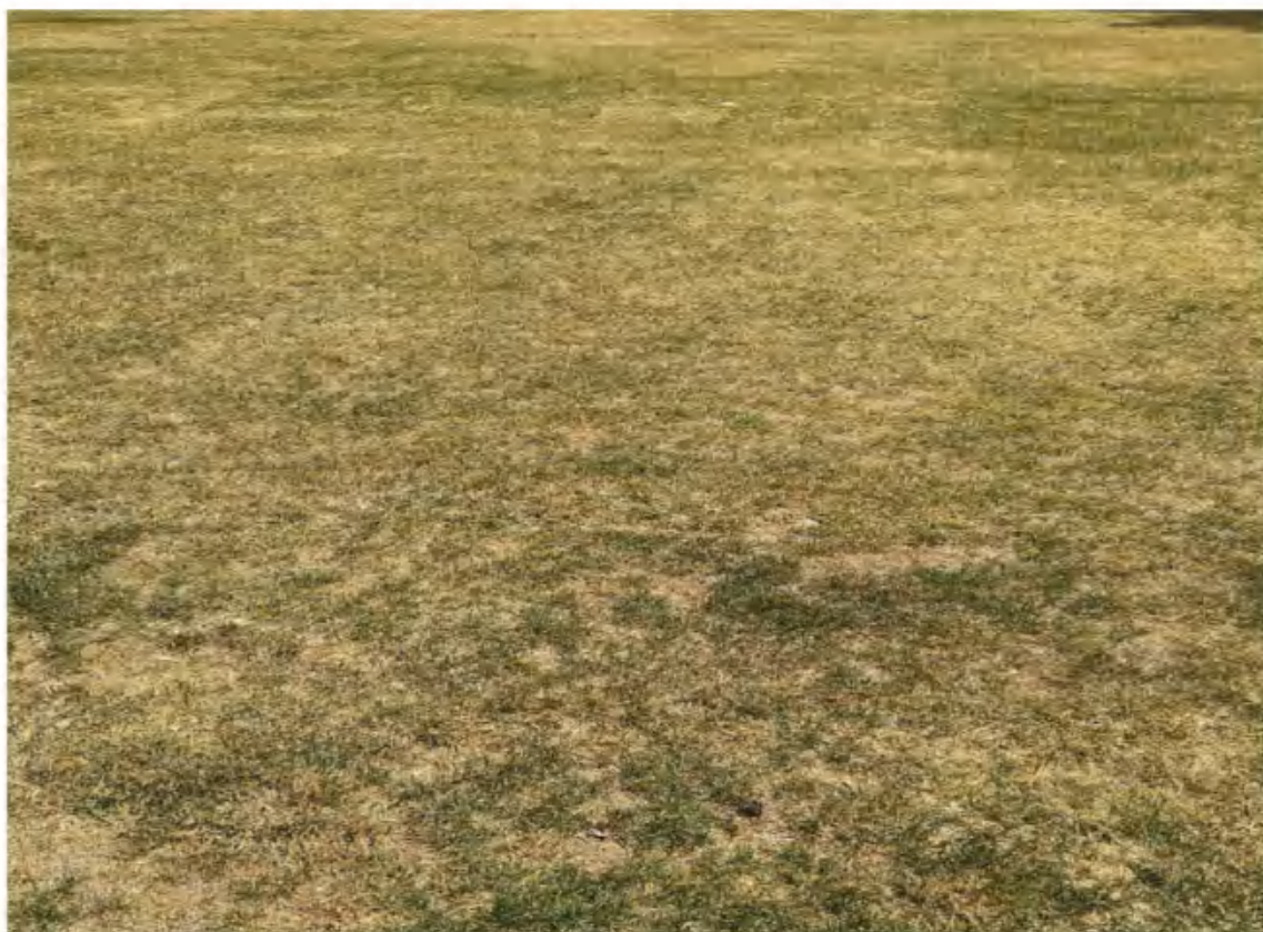
监测到场照片（2022年11月）