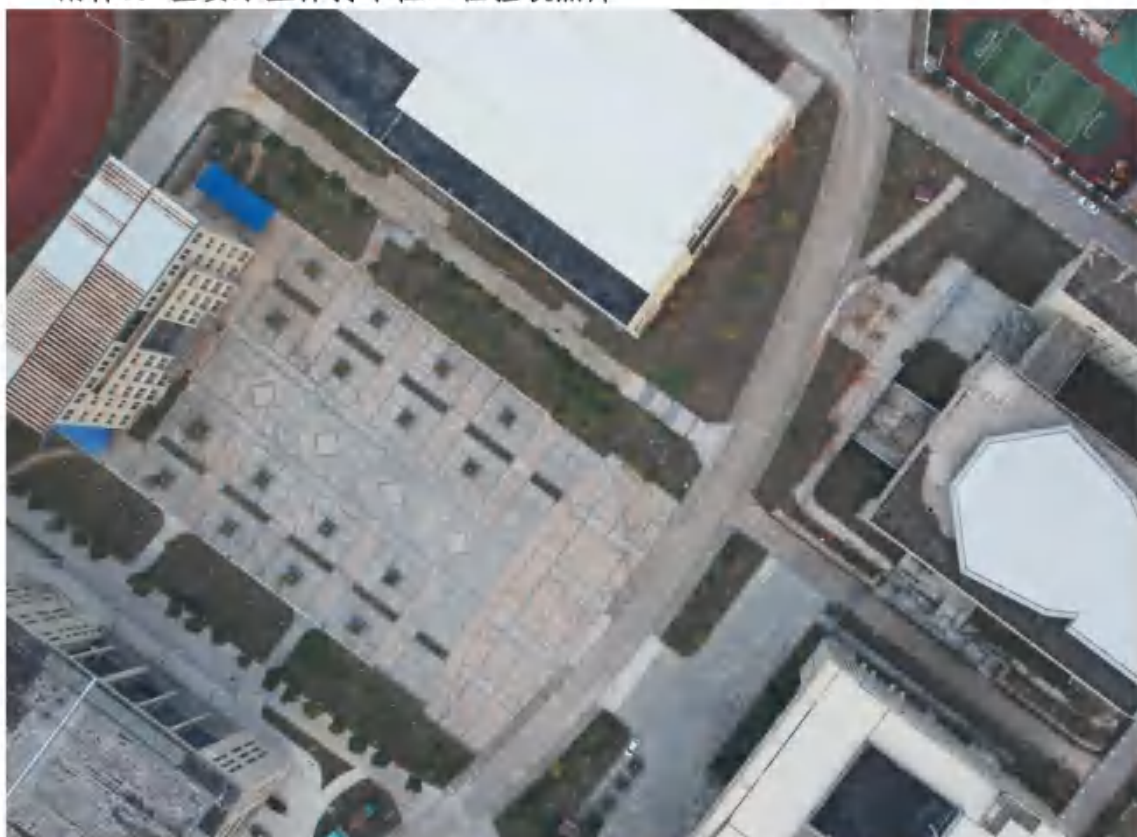
附件6：重要水土保持单位工程验收照片