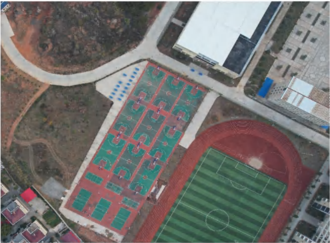
景观绿化措施（2022年11月）