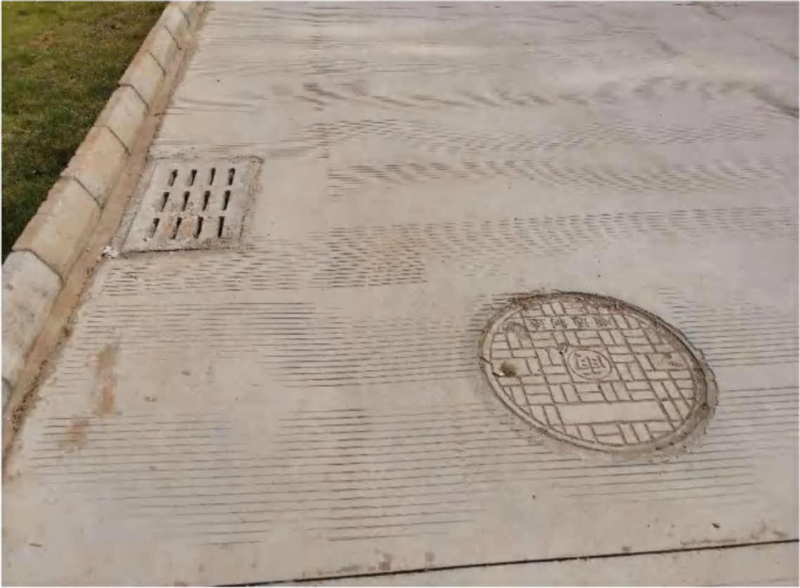
雨水口及雨水井措施（2022年11月）